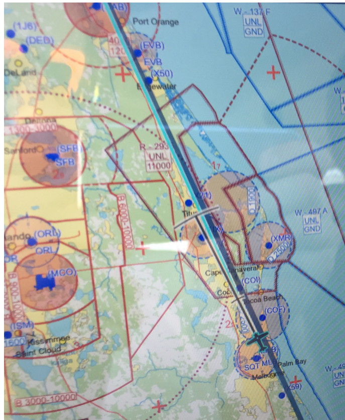
Controller mit kurzer Zündschnur koordinieren hier den Verkehr JÄGER

Höhe spielend einen Platz erreichen hätten können, statt die Maschine im Sumpf, am Strand oder irgendwo im Unterholz permanent zu parken. Nach Flugvorbereitung und Tanken ging es von unserer Standardpiste 31 und einer Linkskurve zurück zur Küste in 4500 Fuß Richtung Süden.