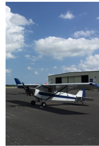
Eine Piper Cub in Vero Beach JÄGER