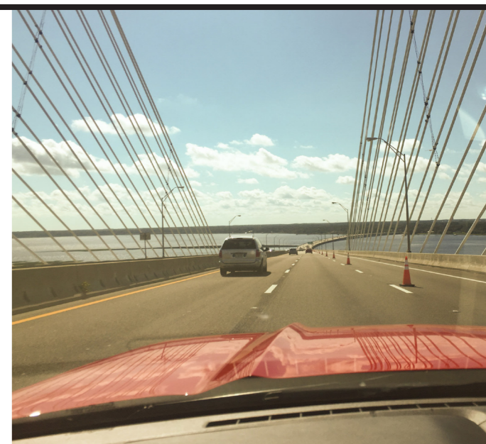
Mit einem Mietwagen ging es vom Airport in Jacksonville ins beschauliche St. Augustine an der Westküste Floridas (o.). In der Flugschule wurde ich bereits erwartet (re.)