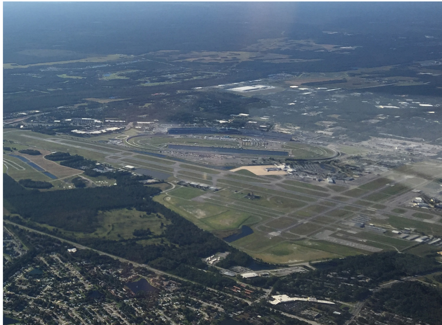
Hier schlägt das Herz des US-amerikanischen Motorsports: Der Daytona Motor-

Genau das ist uns in Daytona Beach passiert. Die Controller von KDAB gelten selbst unter lokalen Piloten als gefürchtet, das hat allerdings auch seinen Grund: Tausende Studenten bzw. Flugschüler der Embry-Riddle Aeronautical University drehen rund um Daytona Beach über das Jahr verteilt ihre Runden und es gibt wohl wenige Dinge, die die Controller dort noch nicht erlebt haben. Wir blieben auf 4500 Fuß und konzentrierten uns auf