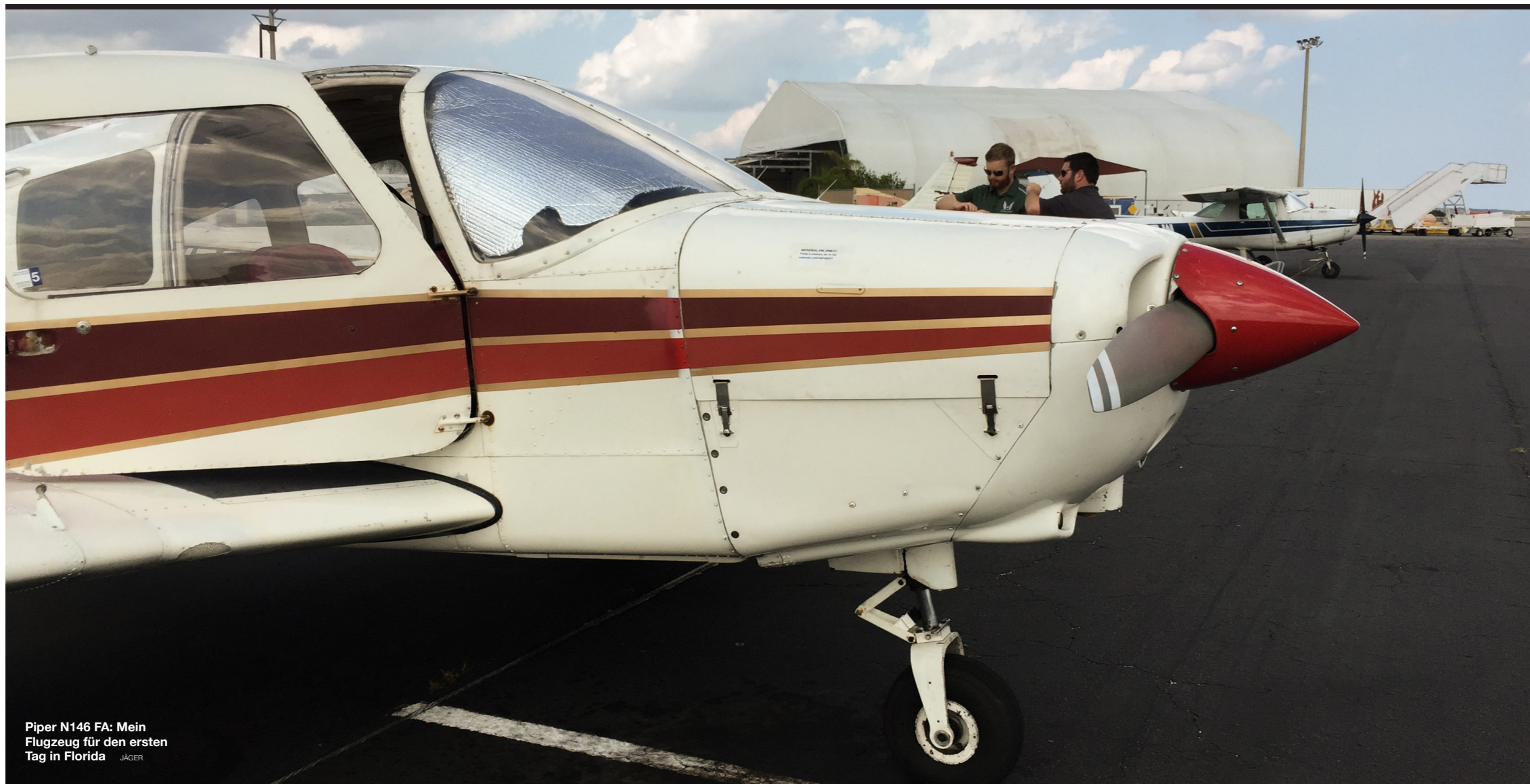
Piper N146 FA: Mein Flugzeug für den ersten Tag in Florida JÄGER