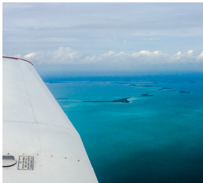
Schöner wird es nicht: Das Meer nahe den Floriday Keys