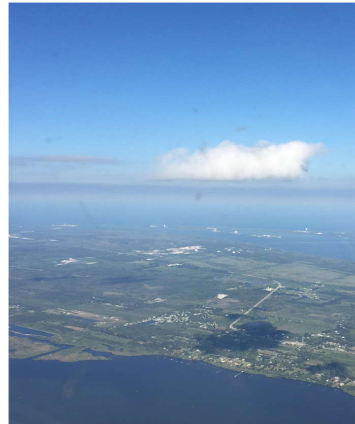
Im Kennedy Space Center landeten einst sämtliche Shuttles der USA JÄGER

Nach einem außerplanmäßigen freien Tag – Jet-lag, Körper und Budget verlangten nach einer Pause – nahm ich in St. Augustine „meine“ Piper N149FA in Empfang, mit der ich die nächsten Tage lang Florida erkunden wollte. Mein Plan: Von St. Augustine an der Ostküste wollte ich zunächst nach St. Petersburg an die Westküste. Das weitere Routing führte weiter über Naples auf die Florida Keys bis nach Key West und auf der gleichen Strecke zurück. Die Westküste ist deutlich ruhiger und bis auf den Tampa International Airport auch frei von