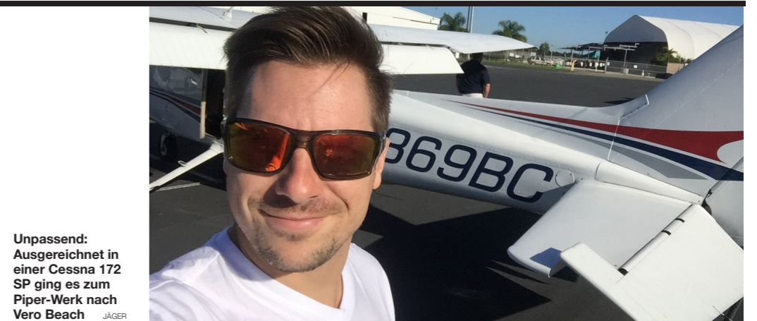
Unpassend: Ausgerechnet in einer Cessna 172 SP ging es zum Piper-Werk nach Vero Beach JÄGER

Was dabei nicht gerne gesehen wird bzw. man keinesfalls machen sollte, ist das sofortige Einfliegen in den Downwind oder straight-in-approaches – beides gilt als unsicher und nachdem genug