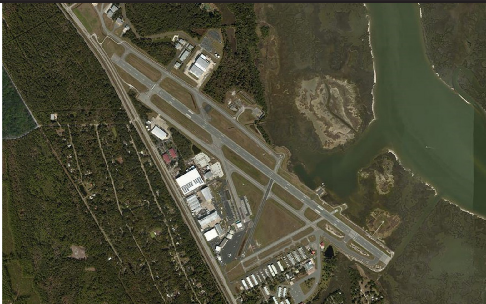
Ganz offiziell heißt der Flughafen “Northeast Florida Regional Airport”, in ganz Florida nennen ihn Piloten aber schlichtweg